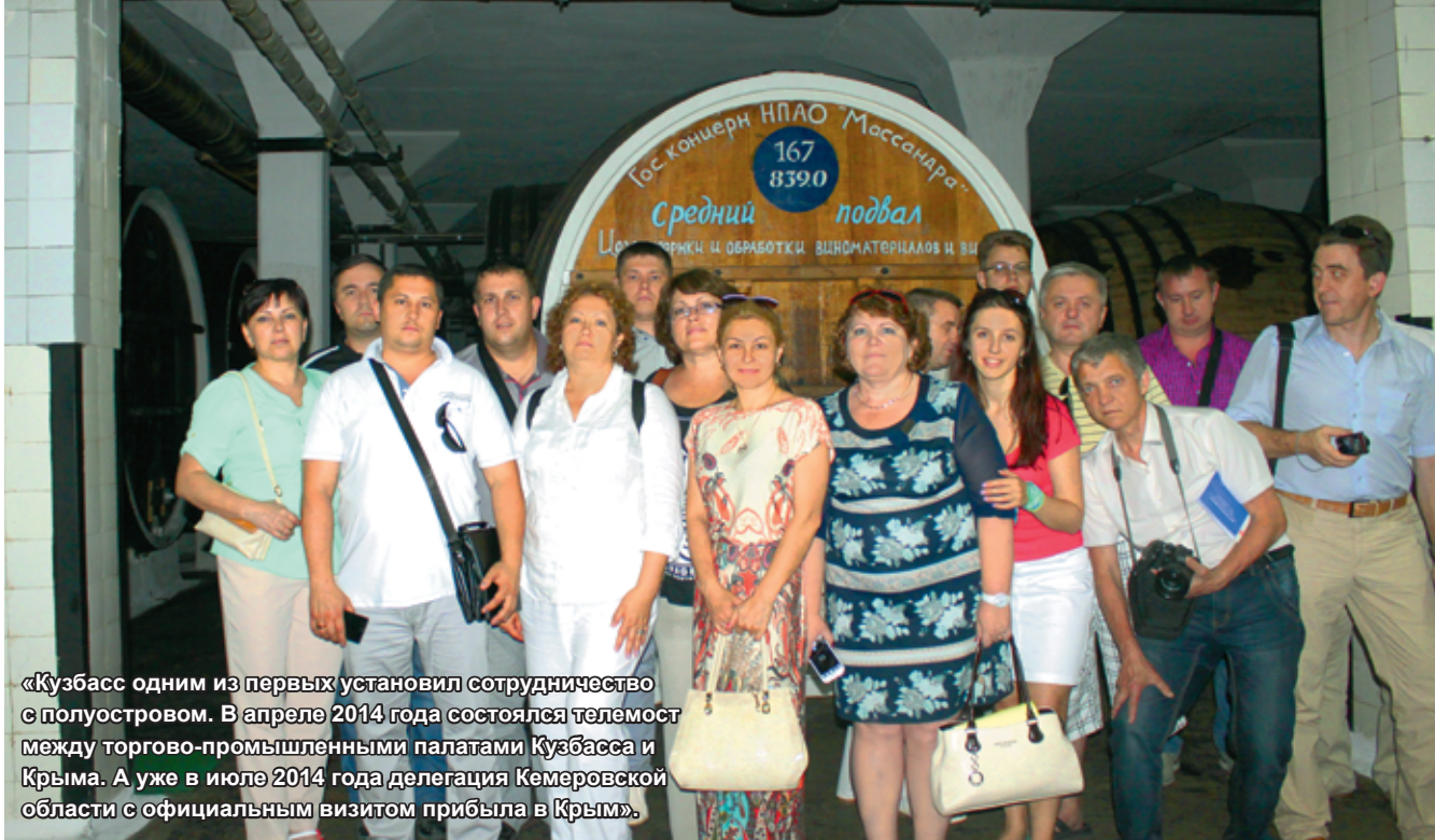
«Кузбасс одним из первых установил сотрудничество с полуостровом. В апреле 2014 года состоялся телемост между торгово-промышленными палатами Кузбасса и Крыма. А уже в июле 2014 года делегация Кемеровской области с официальным визитом прибыла в Крым».

Как и во всей стране, в республике ставка сделана на активную бизнес-среду. Утверждены дорожные карты по внедрению 12 целевых моделей упрощения процедур ведения бизнеса и повышения инвестиционной привлекательности Крыма.