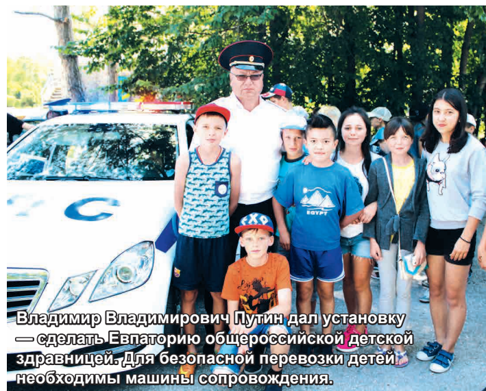
Владимир Владимирович Путин дал установку — сделать Евпаторию общероссийской детской здравницей. Для безопасной перевозки детей необходимы машины сопровождения.

— Зеленая стрелка на Украине была экспериментом. Это дополнение к светофору позволяет водителю совершить поворот направо, если он не создает помеху движению. Как водитель с тридцатилетним стажем, я считаю, что такое решение очень удобно на некоторых участках дорог в Крыму. Но в ПДД РФ нет правил, которые разрешают установку «картонных» стрелок. Должна быть дополнительная секция в светофоре, или стрелка должна дополниться ►