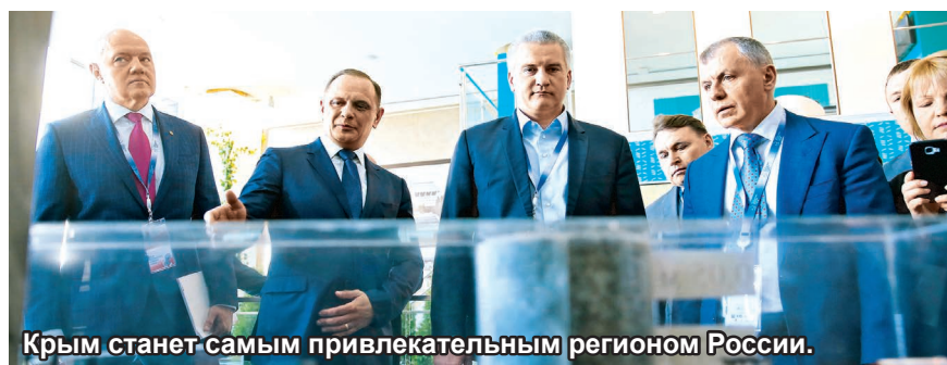
Крым станет самым привлекательным регионом России.

В рамках реализации Стратегии социально-экономического развития Крыма до 2030 года количество рабочих мест в Крыму должно возрасти на треть, средняя продолжительность жизни крымчан увеличится до 75 лет. Ориентировочный объем финансирования, необходимого для реализации стратегии, составит около 5,8 трлн рублей. Соответствующий прогноз озвучил министр экономического развития Республики Крым Андрей Мельников: «К 2030 году доля продукции высокотехнологичных и наукоемких отраслей в валовом региональном продукте должна возрасти с 20 до 45 %. При этом обеспеченность населения республики жильем пла-