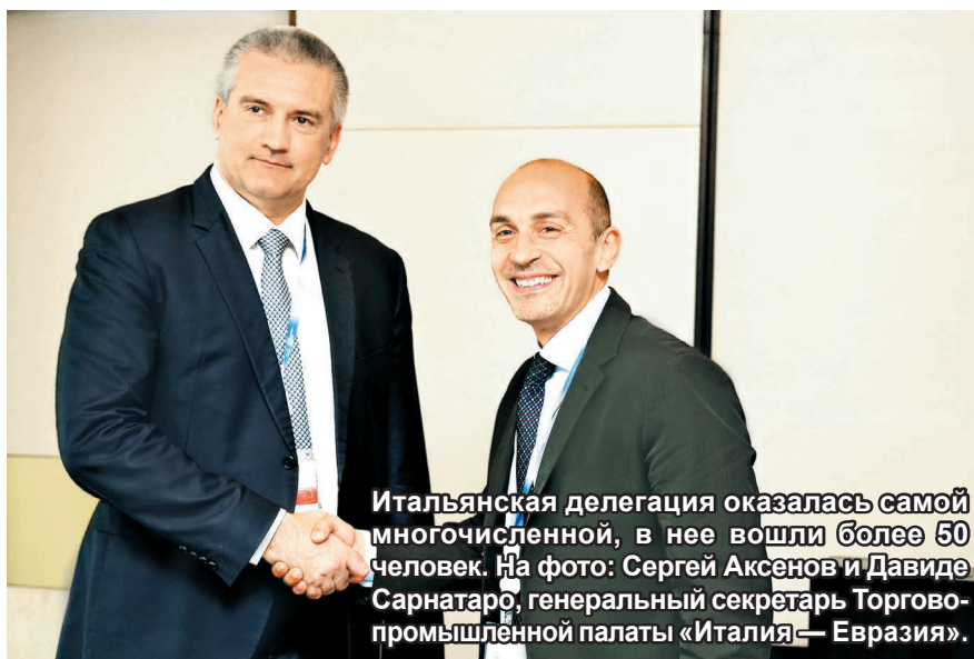
Итальянская делегация оказалась самой многочисленной, в нее вошли более 50 человек. На фото: Сергей Аксенов и Давиде Сарнатаро, генеральный секретарь Торгово-промышленной палаты «Италия — Евразия».

В рамках ЯМЭФ глава Республики Крым Сергей Аксенов провел рабочую встречу с губернатором Краснодарского края Вениамином Кондратьевым. Результатом этой встречи стало заключение соглашения об экономическом взаимодействии двух регионов после ввода в эксплуатацию Крымского моста, когда и контакты, и экономическое сотрудничество между регионами усилятся в несколько раз. ➡