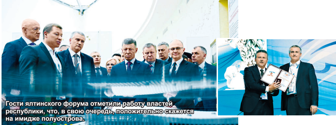
Гости ялтинского форума отметили работу властей республики, что, в свою очередь, положительно скажется на имидже полуострова.

Сергей Аксенов считает, что Крыму нужна продукция Краснодарского края и опыт его лучших практик. Вениамин Кондратьев в свою очередь предложил создать единый туристический маршрут по морскому побережью России от Краснодарского края до Крыма и организовать воздушное сообщение между регионами. Кроме того, главы регионов планируют проработать совместную стратегию развития территорий.